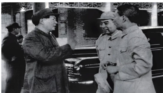
1949年8月，毛泽东、周恩来等在车站等候宋庆龄

1949年1月，毛泽东、周恩来联名致电在上海的宋庆龄，邀请她参加新政协筹备工作。5月27日上海解放。6月，中共中央派邓颖超携带毛泽东、周恩来的亲笔信，专程赴沪，邀请宋庆龄北上商筹建设大计。8月28日，宋庆龄在邓颖超、廖梦醒陪同下乘专车抵达北平，毛泽东、朱德、周恩来、林伯渠、李济深、何香凝、沈钧儒等到车站迎接。