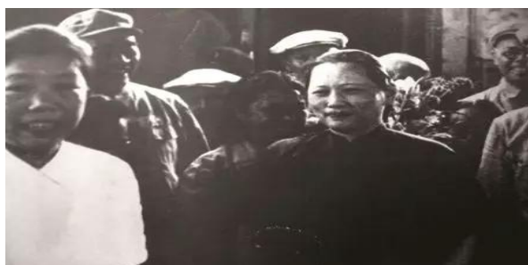
1949年8月，宋庆龄在邓颖超的陪同下抵达北平